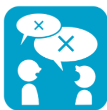
大声での会話は お控えください